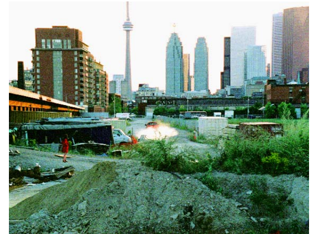
Downtown Tilt Zoom and Pan Film Still, 2005

Es también a finales de los 90 cuando Lewis, próximo al denominado en su día grupo de Vancouver influido por