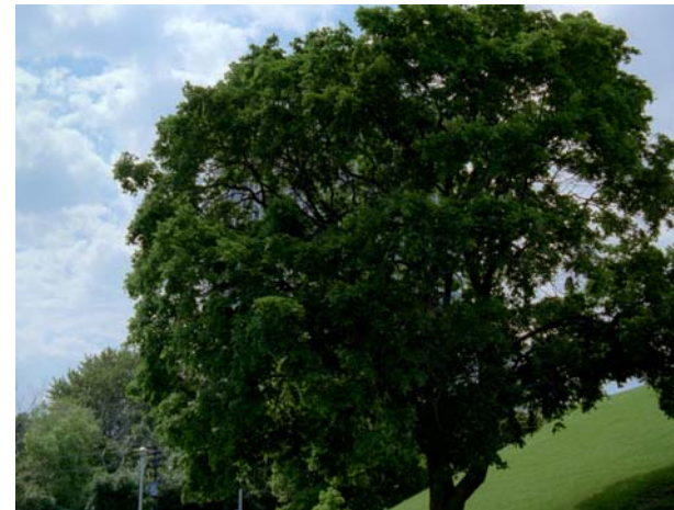
Spadina: Reverse Dolly, Zoom, Nude, 2006